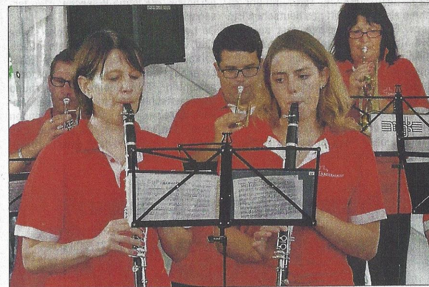
Für die musikalische Umrahmung war bestens gesorgt

länglichkeiten. Eines immer im Auge behaltend: Seine Liebe zur Schweiz, seine Liebe zu Kaiseraugst. «Bei uns in der Gemeinde gibt es über 40 Nationalitäten verschiedener Religionen und verschiedenen Glaubens, die friedlich miteinander leben und sich akzeptieren und res-